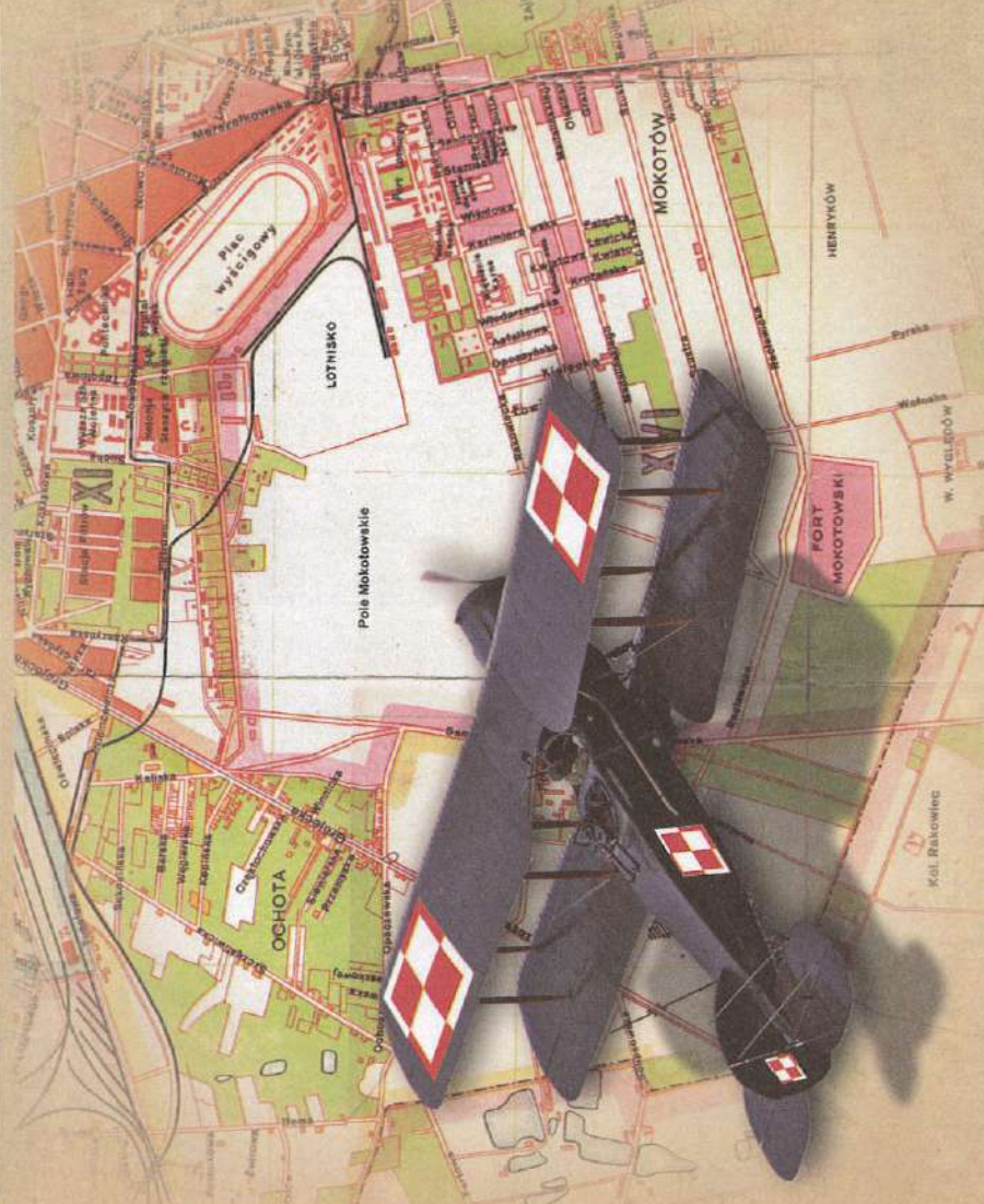
Ulica Opaczewska i lotnisko na Polu Mokotowskim na planie Warszawy z 1926 r. Z tego własne lotnisko startowały samoloty wspierające obronę przedmościa warszawskiego. Imiętna część ul. Bitwy Warszawskiej 1920 r. przebiega między Przemyską a Opaczewską po lewej stronie Grójeckiej, natomiast Opaczewska po prawej stronie Grójeckiej maś dziś nazyw. ul. Banacha ( www.mapywig.org/ )