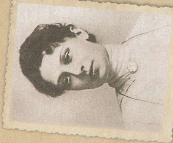
Fotografia Marii Koszusińskiej z przedmościa warszawskiego. Znana z wyjątkowej urody socjalistka była zapożyciem natchnieniem dla wielu swych towarzyszy w prowadzeniu walki klas. Komunistki sowieckie tego typu sentymentów nie żywiły

Ulica Bitwy Warszawskiej 1920 r. została wyznaczona w latach 40. ubiegłego wieku. W związku z tym, że przebiegała w pobliżu dobrze znanej ulicy Opaczewskiej, nazwano ją Nowoopaczewską. W 1956 r., chcąc uczcić świeżo zrehabilitowanych członków Komunistycznej Partii Polski, którzy padli ofiarą stalinowskiej czystki z 1937 r., ulicę nazwano imieniem Wery Kostrzewy (właśc. Marii Koszusińskiej). Była ona początkowo zwolenniczką PPS Frakcji Rewolucyjnej i udzielała się w Organizacji Bojowej organizującej walkę zbrojną z Rosjanami podczas rewolucji 1905 r. Nie wysiadła jednak z „czerwonego tramwaju” razem z Józefem Piłsudskim na „przystanku niepodległość”. Działała w KPP, także w czasie wojny polsko-bolszewickiej. W lipcu 1920 r. została aresztowana wraz z innymi działaczami KPP. Wypuszczono ją w następnym roku, po zakończeniu wojny polsko-bolszewickiej. Wera Kostrzewa nie popierała jednak leninowskiego „ekspertu rewolucji na bagnietach Armii Czerwonej”. Liczyła na to, że polscy robotnicy sami przeprowadzą rewolucję w swym kraju. Nie doczekawszy tego, wyjechała do Związku Sowieckiego, została aresztowana i osądzona. Zmarła w więzieniu.