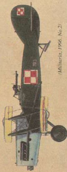
(Militaria, 1996, No. 2)

Teren, po którym przebiega dzisiejsza ulica Bitwy Warszawskiej, 93 lata temu miał charakter przedmiejski. Dominowały tu drewniane domki z ogródkami warzywnymi, a także duże gospodarstwa „eksploatujące” płody rolne do Warszawy. Ochotę włączono w obręb Warszawy podczas niemieckiej okupacji, w 1916 r. – wówczas granicę wyznaczono na Opaczewskiej. Ulica ta znana była także pod nazwą Drogą Rakowieckiej. Rozwój Opaczewskiej przyniósł dopiero lata 20., kiedy to Ochota została przekształcona w miasto – ogród i zaczęła być postrzegana jako pełnoprawna dzielnica Warszawy. Jednak już w roku 1920 rozwój cywilizacyjny startowały z pobliskiego lotniska na Polach Mokotowskich. Od czasu do czasu, jak na dzisiejsze standardy bardzo często, zdarzały się też katastrofy lotnicze. Samoloty spadały także na ulice Ochoty, budząc grozę, ale i podziw dla odwagi lotników. Podczas walk o Radzymin z Lotniska Mokotowskiego startowały najnowocześniejsze nasze samoloty, dwumiejscowe Bristol F.2 Fighter produkcyjnej angielskiej, należące do 10 eskadry wywiadowczej.