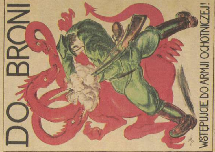
Plakat propagandowy z 1920 r.

Dzięki ogromnej mobilizacji udało się zatrzymać bolszewików na przedpolach Warszawy, a później odeprzeć. Było to wielkie i błyskotliwe zwycięstwo. Czy jednak faktycznie była to „18. przełomowa bitwa w dziejach świata”, jak określił je lord Edgar