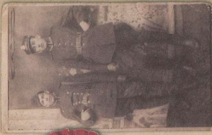
Zdjęcie pamiątkowe żołnierzy WP, Lida 1922 r. Żołnierze z lewej w „huncie”, z prawej w kurtce mundurowej wz. 1919

1 lipca 1920 roku Rada Obrony Państwa zdecydowała o utworzeniu Armii Ochotniczej. W wyniku kampanii propagandowej prowadzonej z dużym rozmachem do wojska zgłasza się wielu ochotników. Do września 1920 r. do Armii Ochotniczej wstąpiło prawie 110 000 osób. Dowódcą Głównego Inspektoratu Armii Ochotniczej był gen. Józef Haller. Jednym z większych wyzwań, jakie stały przed GłO, była konieczność umundurowania żołnierzy — ochotników. Na ilustracjach z epoki powszechnie przedstawia się ich ubranych w polskie mundury wz.1919 i helmy francuskie Adrian wz.15, furażerki bądź okrągłe czapki zwane „angielkami”. Mundur wz.19 składał się z kurtki wykonanej z sukna w kolorze khaki i bryczesów wykonanych z tego samego materiału. Do tego dochodziły owijacze i trzewiki w piechocie lub długie buty w kawalerii. Rzeczywistość przedstawiała się jednak nieco inaczej. Mundur wz.19 dopiero był wprowadzany i nie nadążano z jego produkcją. Aby umundurować tak liczną i szybko powstającą armię, sięgnięto po wszystko, co było w magazynach. Znajdowało się w nich wiele rodzajów i modeli umundurowania pochodzących z różnych armii świata.